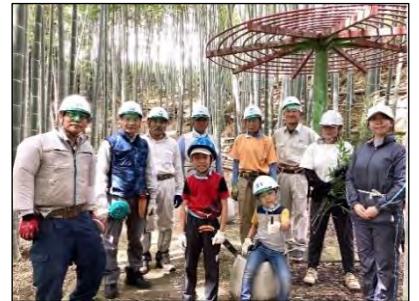
お試し体験入隊の若き竹翁たち

2月から3月の間伐はマダケとの境界緩衝部モウソウチクから始めて、チェンソー1台で小面積の急斜面から約80本を間伐。その後は上部のサブプール際、下の東屋エリアへと移動して竹垣改修材と地域団体イベントへ提供する材料を確保しました。4月に入ると間伐竹の利活用開始！竹灯籠づくりを2日で終え、竹垣改修を間に挟んで竹灯籠の設置へと進みました。竹取協力隊のベテラン勢とユーピーエス・ジャパン株式会社の社員さん、国際ボランティア学生協会VUSAさんの若い力が加わった協働は、初の5月開催のまつりに向けて順調に進んで18日に計画通り1000人のお客様さまを無事迎えました。まつり後の竹灯籠処理は大多数を割って竹林内で処理、一部の上