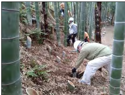
法面で慎重に竹灯籠の設置

まちづくりまちおこし地域最大のイベントが計画通りに約1,000名のお客様を迎え無事安全に終えることができました。