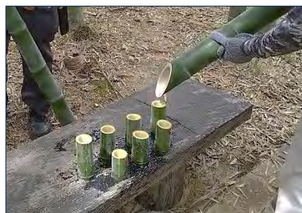
長寿水「竹水」を頂く

部設置分だけはチップ処理とした。恒例の5月初旬に仕込んだ長寿水「竹水」は3週間後に切り、美味しくいただきました。6月は竹林整備、若竹や枯竹の伐採、お礼肥として15kg入り米糠2袋をまつりメイン会場の平坦部に埋めました。