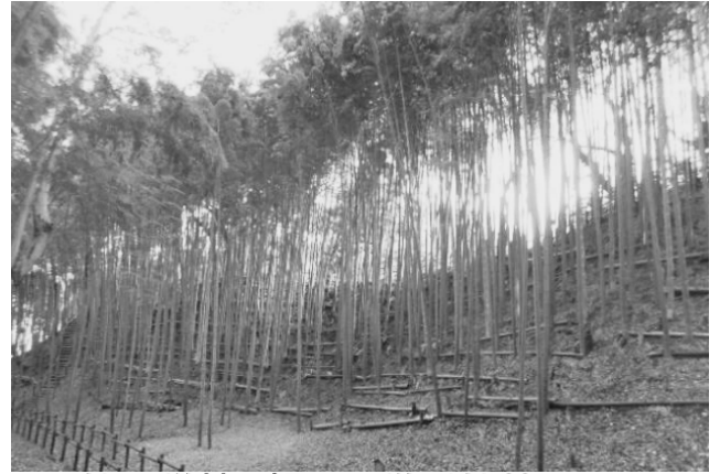
竹の学校 親子で学ぶ竹林コース