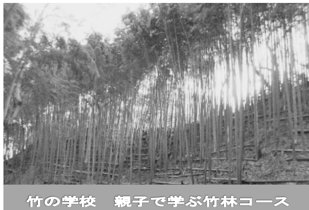
竹の学校 親子で学ぶ竹林コース

横浜市北部 都筑区折本の竹林の中をめぐり 心身ともにリフレッシュ 日本の原風景の素晴らしさを学ぼう 各回ごとの募集です お好きな回に参加できます