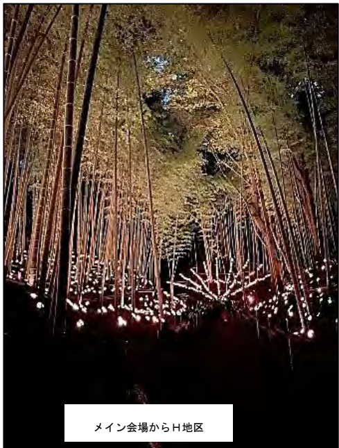
メイン会場からH地区